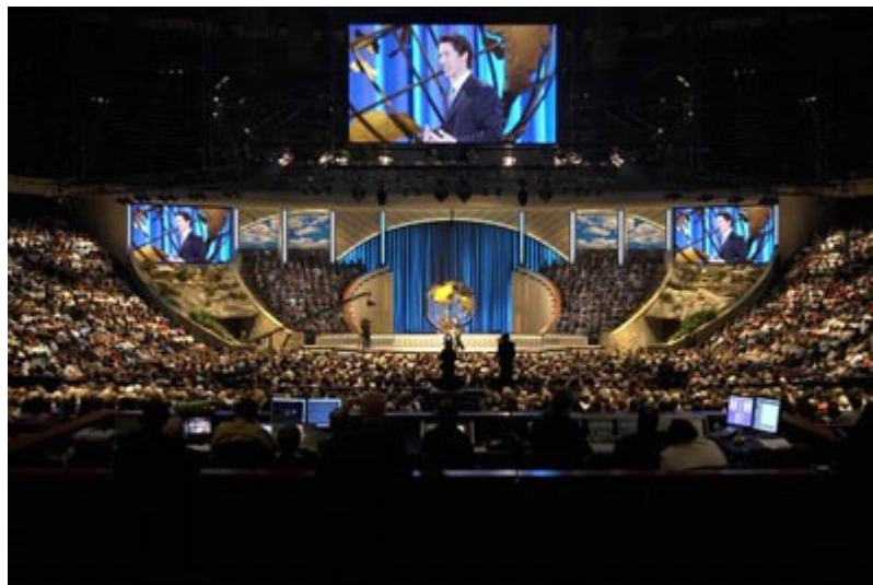
Joel Osteen en la colosal LakewoodChurch

Uno de los principales valedores del “mensaje positivo”, de la “confesión positiva”, “pensamiento positivo”, “optimismo a ultranza” es sin duda alguna Joel Osteen, el pastor de la congregación más grande de Estados Unidos, Lakewood Church, in Houston, Texas.